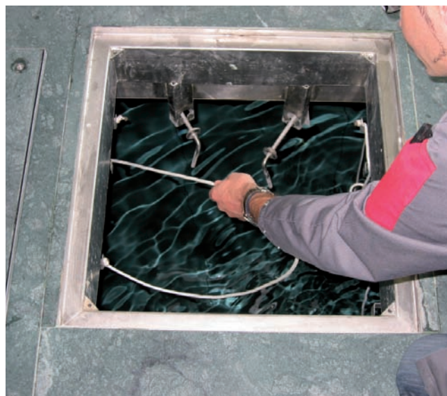
► Un trou d'homme situé au centre du fond mobile permet l'accès sous celui-ci, une fois le bassin vidé