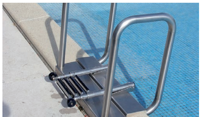
... ou d'une simple échelle en acier inoxydable.