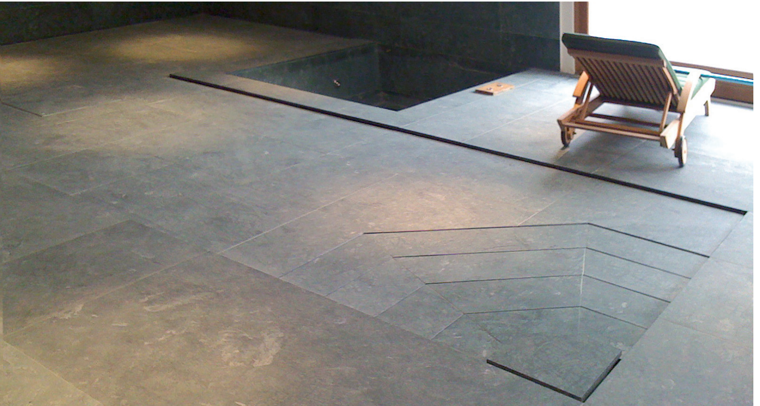
► Revêtement adapté à l'architecture de votre bâtiment