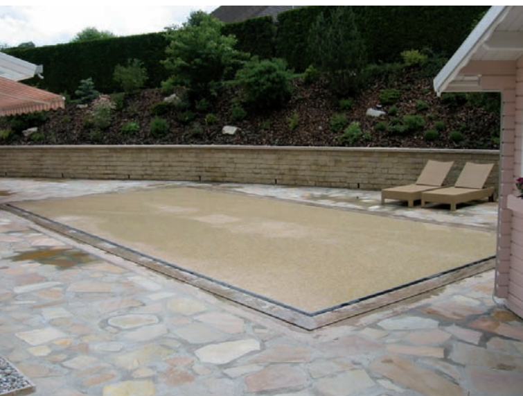
► Le fond en position haute isole le plan d'eau et évite les déperditions de chaleur