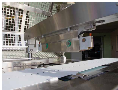
▶ Système de mâchoire de soudure transversale