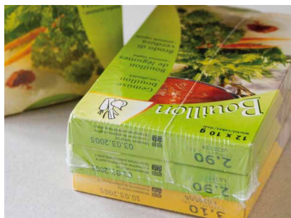
► Film rétractable pour suremballage