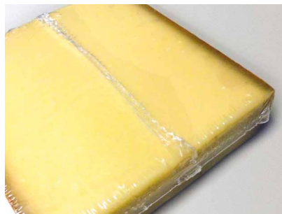
► Film rétractable barrière