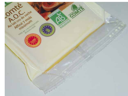
► Film laminé pour longue conservation