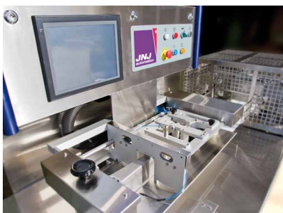
▶ Système de mise en forme du film